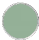
VERNICE Absolute Paint KK 36 della Color Collection [Kerakoll].