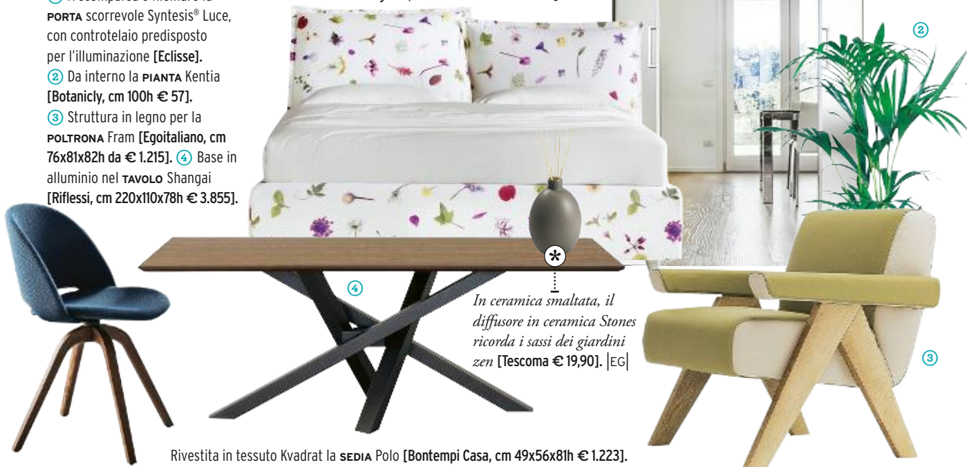
In ceramica smaltata, il diffusore in ceramica Stones ricorda i sassi dei giardini zen [Tescoma € 19,90]. |EG|

Il LETTO SO Wild decorato con vere immagini di fiori delle colline marchigiane [Noctis, con Folding Box, cm 178x228x106h € 1.767].