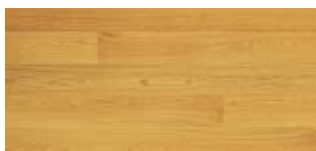
PARQUET collezione Type, in rovere commerciale spazzolato [Unikolegno].