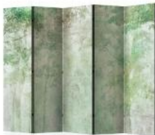
PARAVENTO con 5 pannelli Forest Relief [Bimago, cm 225x172h € 190].

Esalta il più possibile il fattore luce naturale. Come? Con il legno chiaro, il bianco e i toni delicati del verde acqua.