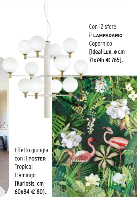
Con 12 sfere il LAMPADARIO Copernico [Ideal Lux, ø cm 71x74h € 765].