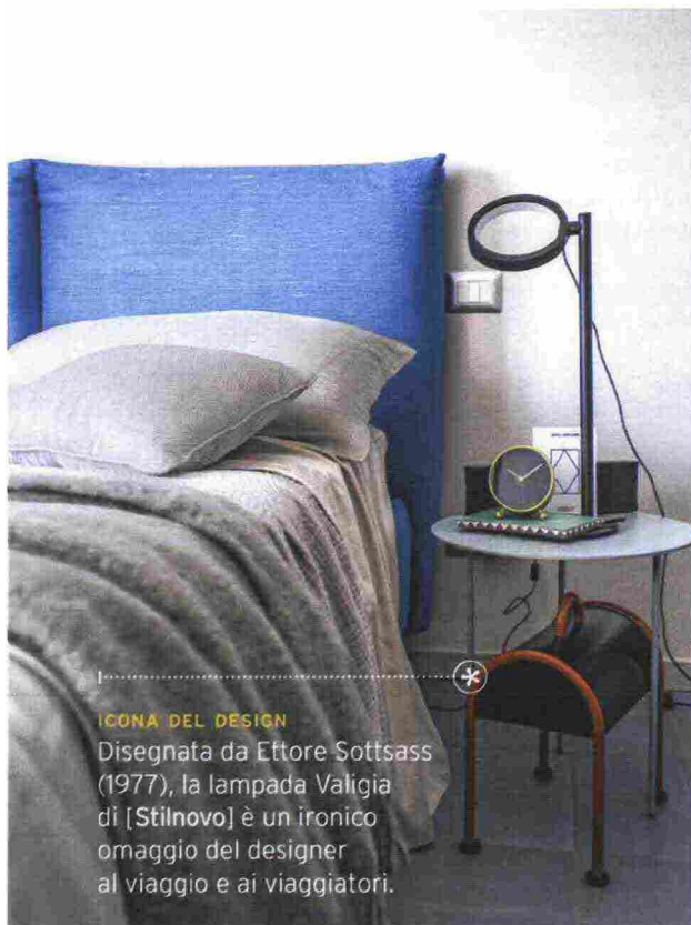
ICONA DEL DESIGN Disegnata da Ettore Sottsass (1977), la lampada Valigia di [Stilnovo] è un ironico omaggio del designer al viaggio e ai viaggiatori.